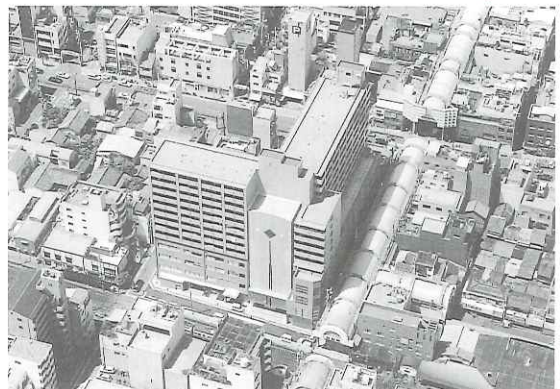
片原町駅西第 3 街区（香川県高松市）