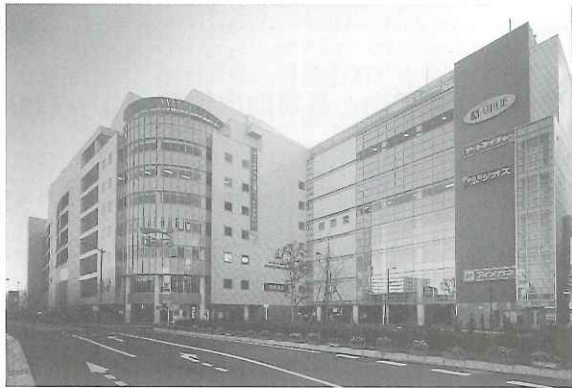
熊谷駅東地区（埼玉県熊谷市）