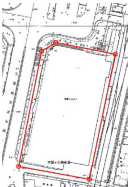
高度利用地区の区域図