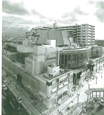
高石駅東B地区（大阪府高石市）