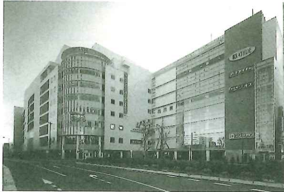
熊谷駅東地区（埼玉県熊谷市）